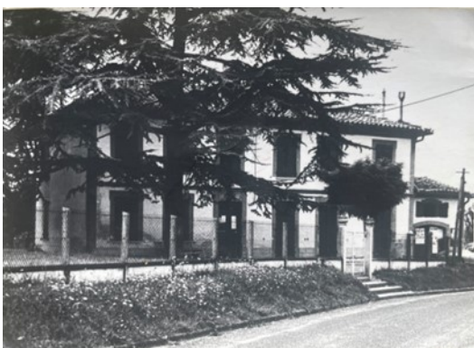
La maison avant 1975