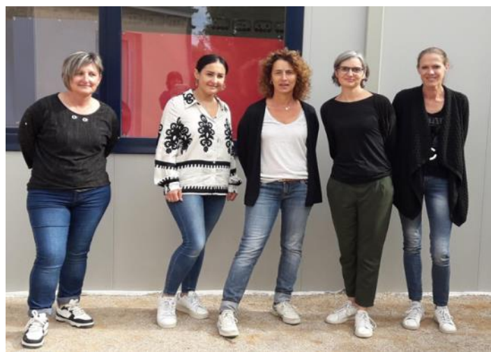
L'équipe pédagogique de l'année 2024-2025