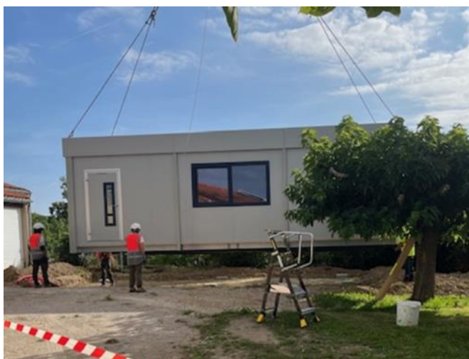
La nouvelle classe des CP